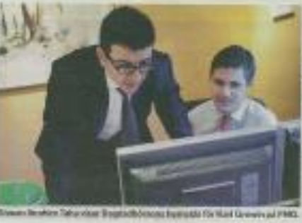
Styrelsen i Rabee Securities. Bilden är ett exempel på en värld som återhämtar sig från finanskrisen och lägger till till en katastrof.